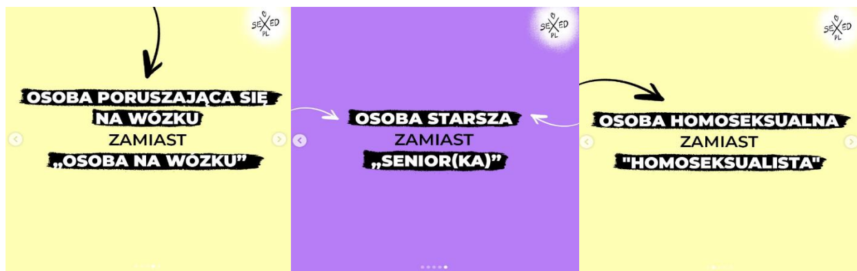
Grafika nr 1. Zapisy równościowe na portalu sexed.pl