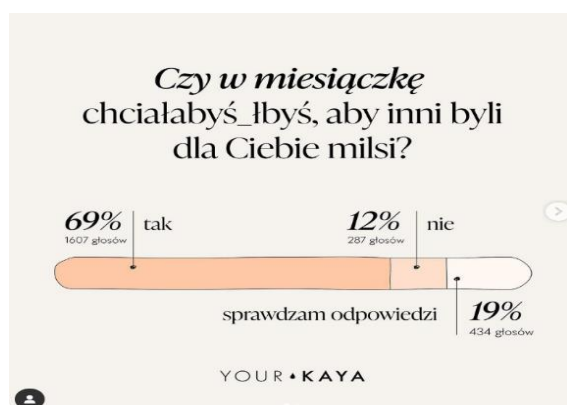
Grafika nr 2. Zapisy równościowe na portalu yourkaya